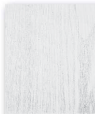
Esche weiß deckend