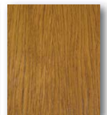
Eiche Golden Oak