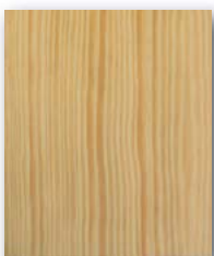
Kiefer astfrei natur